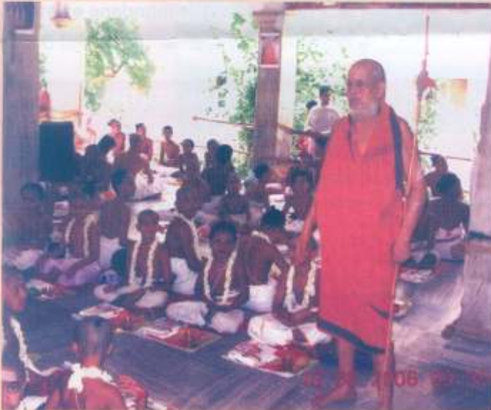
The Acharya at the 72-vatu puja at Kanchi.

The 72nd Jayanti of Pujyashri Jayendra Saraswati Swamigal was celebrated with great devotional fervour at the Kanchi Math on 10.8.2006. After worshipping at the Adhishtanam of Pujyashri Mahaswamigal, Pujyashri Acharya proceeded to the temple of Sri Kamakshi in a procession with caparisoned elephants leading and women carrying 108 milk pots following to the accompaniment of nadaswara music and 72 tavil players. After performing abhishekam to Goddess Kamakshi with milk from 108 pots, the Acharya decorated the idols of Kamakshi and Adi Sankara with golden kireetams. He was offered temple honours. The Acharya gave anugrahahashanam to the multitude of devotees who had gathered at the temple.