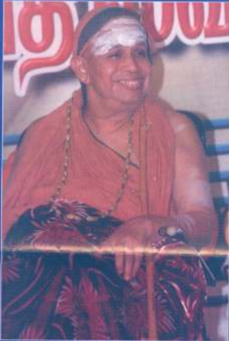
Pujyashri Jayendra Saraswati Swamigal at his 72nd Jayanti Celebrations at Vani Mahal, Chennai.

A QUARTERLY NEWSLETTER HIGHLIGHTING THE ACTIVITIES OF THE KANCHI MATH